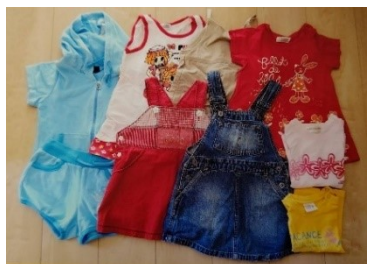
B-59 女児ベビー服 90 サイズ