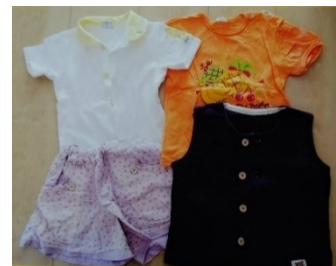
B-60 女児ベビー服 95 サイズ