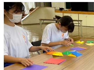
折り紙教室ボランティア