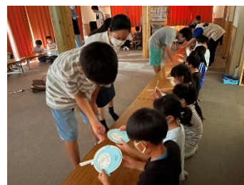
学童保育ボランティア