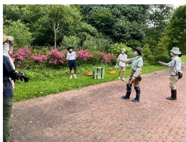
森林公園ボランティア

職員さんの話ではたま～に野ウサギを見かけるとか・・・自然豊かな森林公園ならではのエピソードですね♪