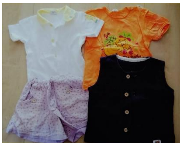
B-60 女児ベビー服 95 サイズ