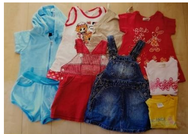
B-59 女児ベビー服 90 サイズ