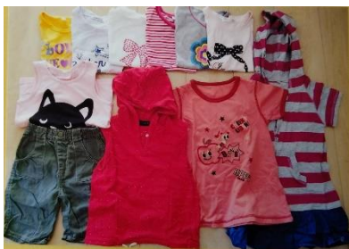
B-62 女児ベビー服 110 サイズ