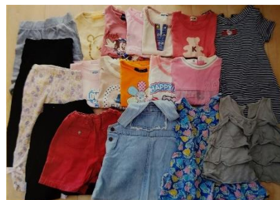
B-61 女児ベビー服 100 サイズ