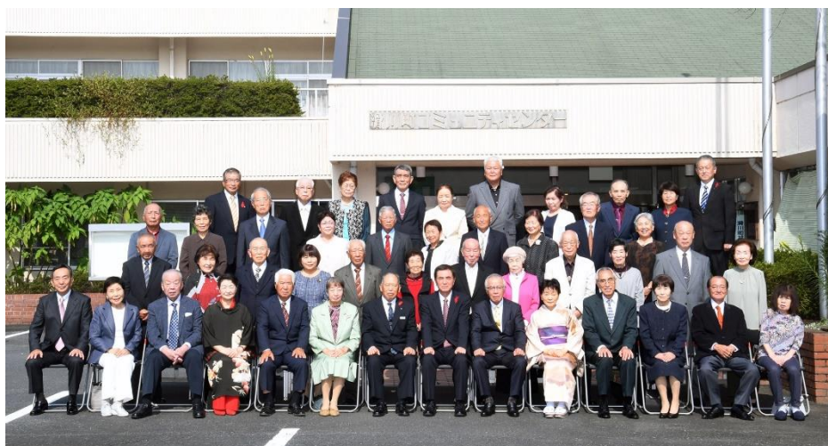
コミュニティセンターで「金婚式」のお祝いを実施しました。