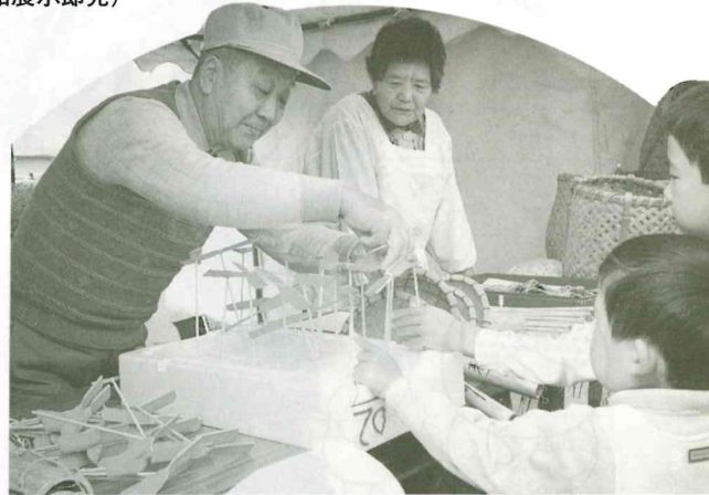
老人クラブ連合会