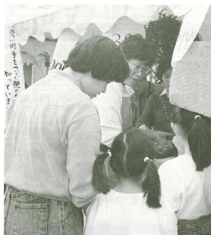
手をつなぐ親の会 (手作り作品展示即売)

晴天に恵まれた、十一月三日(日)滑川まつりにあわせ社協では、福祉まつりを開催しました。今年滑川町手をつなぐ親の会が加わり、老人クラブと2団体が手作り作品