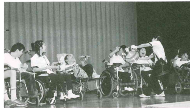
◀福祉ふれあいのつどい

申込期日 3月31日(水) 場所 ボランティアセンター (社会福祉協議会内) ☎ 56-6345