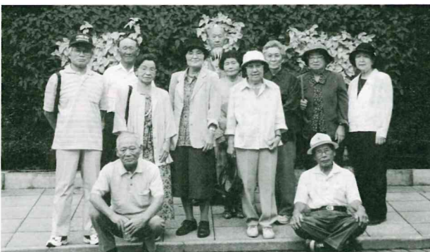
◀ 単身老人保養旅行