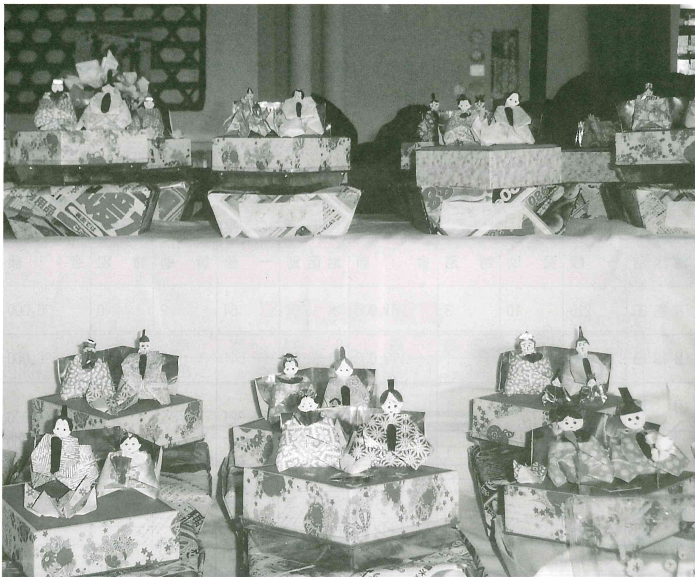
▲いきいき「サロン」ひなまつり（折紙びな）