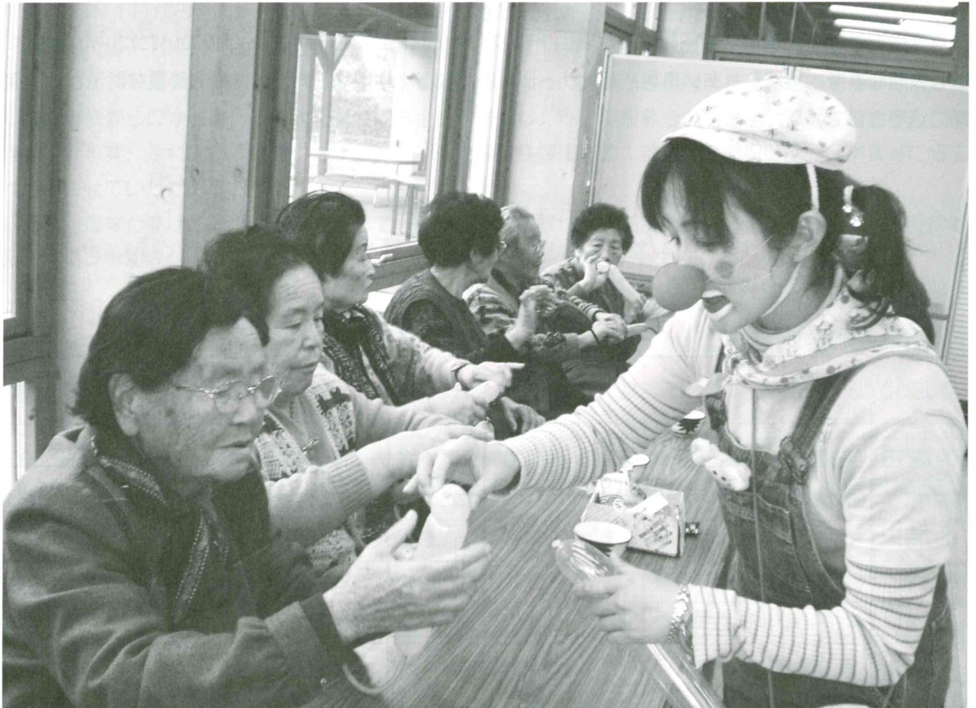
▲いきいきサロン（さいのくにケアリングクラウン隊の皆さんと楽しいひととき）