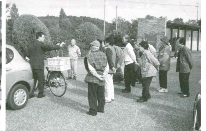
交通安全指導(東松山警察署来所)