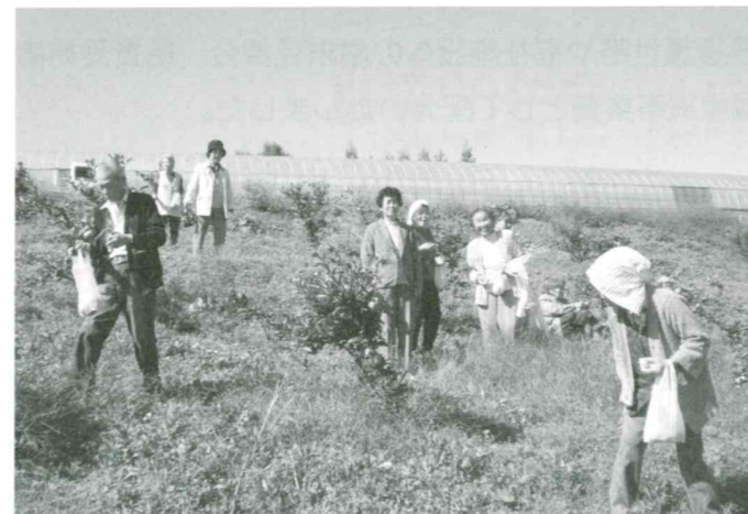
谷津の里にてみかん狩り