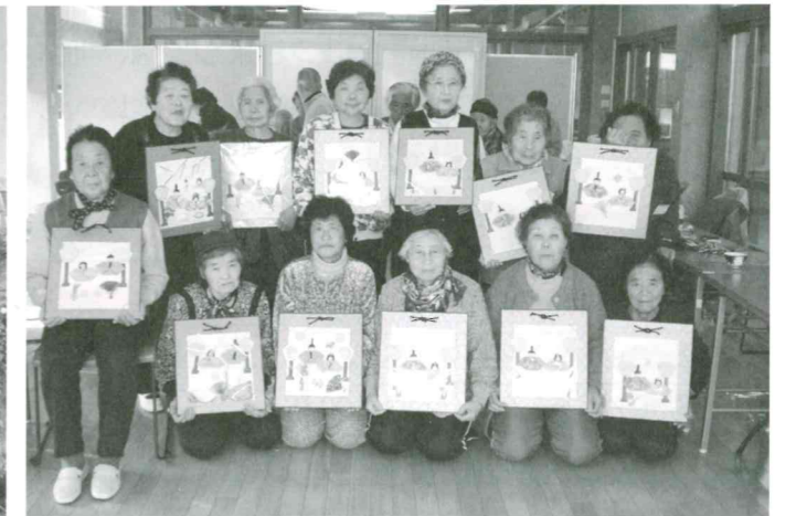
桃の節句にお雛様づくり