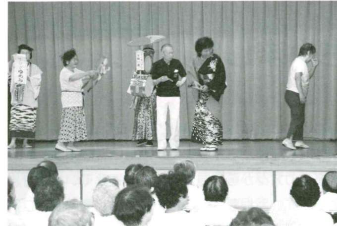
納涼祭(滑川チンドンの皆さんと一緒に)