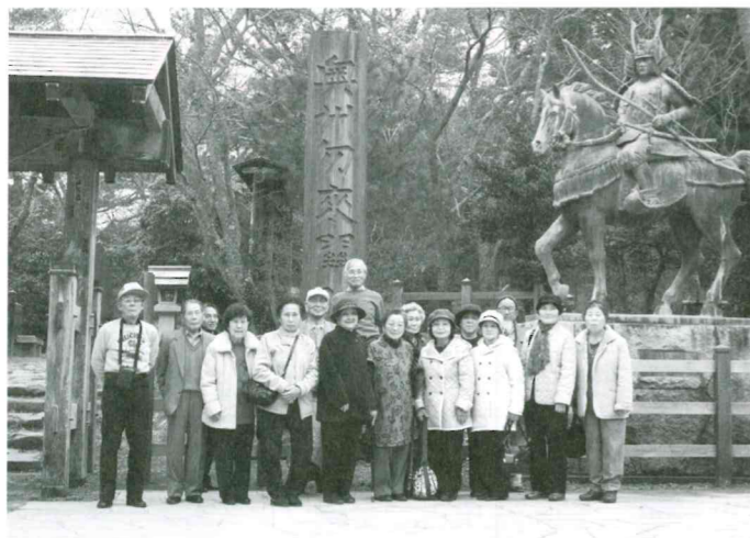
いわき市勿来関文学歴史館