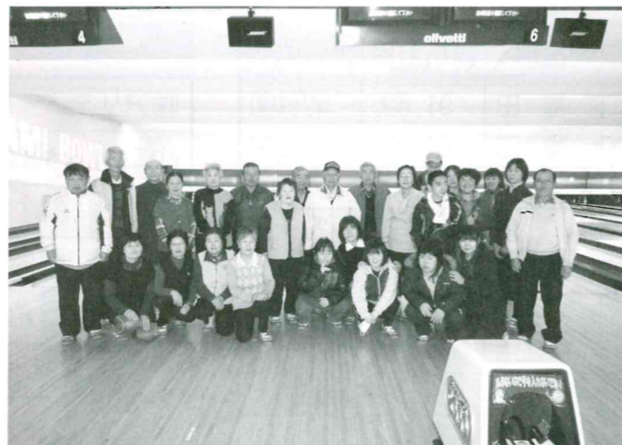
小川町ミナミボウル