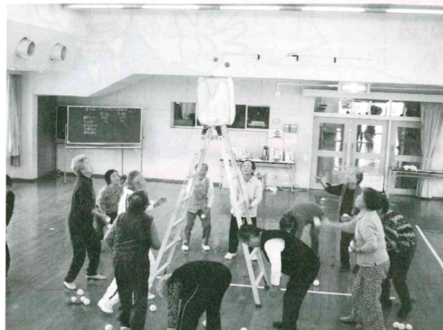
コミュニティセンターにて実施