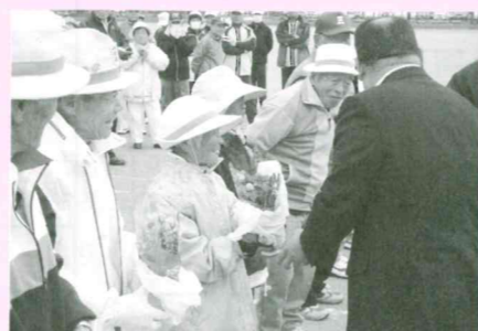
最高齢の方々に記念品を贈呈しました