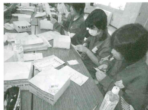
使用済みの切手収集作業