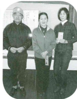
3位 準優勝 優勝

誰でも気軽に参加できる楽しい仲間づくり ふれあい「いきいきサロン」に出かけてみませんか？