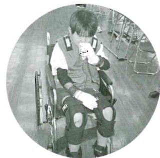
高齢者疑似体験グッズを着用