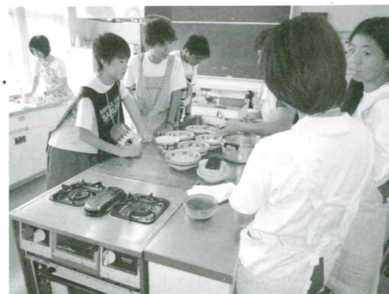
閉会式にけんちんうどんを作って食べました