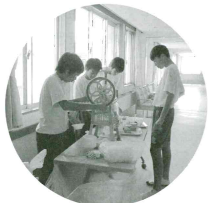
いづみケアセンター利用者の方々にかき氷のプレゼント