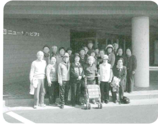
平成23年2月25日 場所：ニューサンピア埼玉おごせ