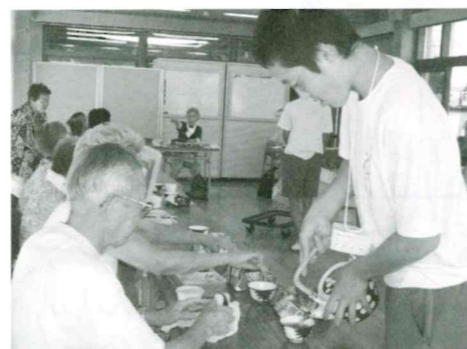
“いきいきサロン”にて高齢者とのふれあい