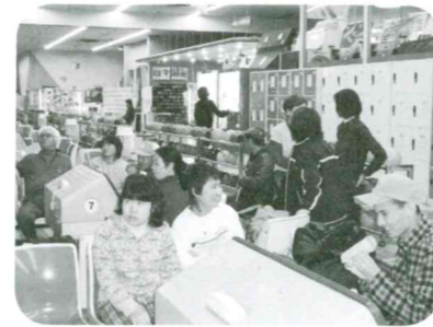
平成23年2月28日 場所：小川ミナミボウル