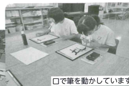
□で筆を動かしています