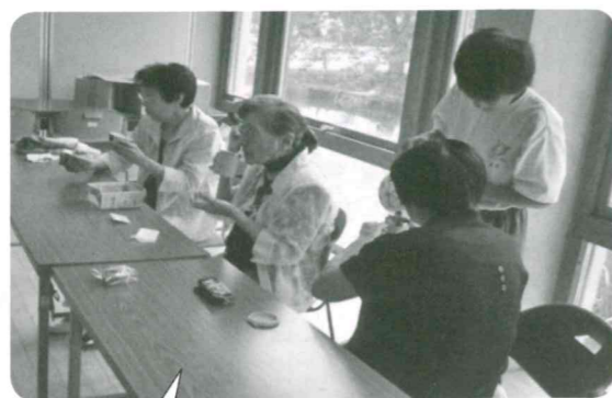
いきいきサロンでの体験