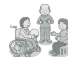
ふれあい大笑庵にて