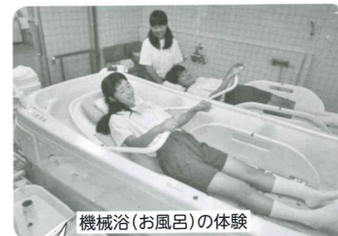
機械浴(お風呂)の体験