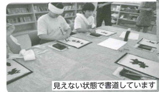
見えない状態で書道しています