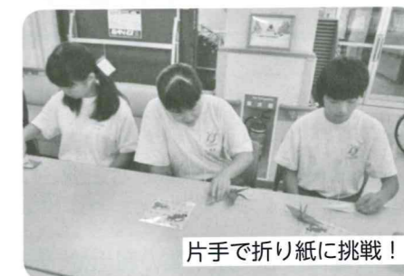
片手で折り紙に挑戦！