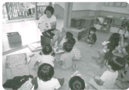
白い馬保育園での体験

◎福祉の事に興味を持った方たちがいろんな形でボランティアに参加してくださいました。 来年度もたくさんの方たちの参加をお待ちしております！