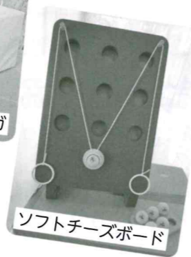
ソフトチーズボード