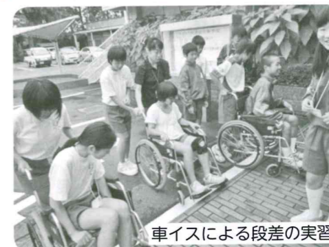
車イスによる段差の実習