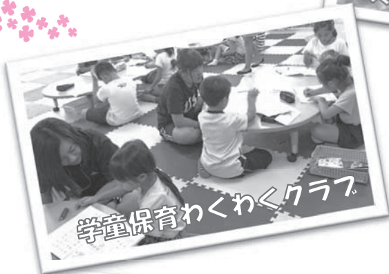
学童保育わくわくクラブ