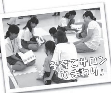
子育てサロン「ひまわり」