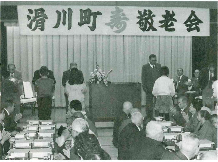
写真↑ 敬老会 写真↓ 産業展