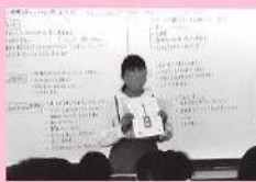
発達凸凹当事者 (発達障害)