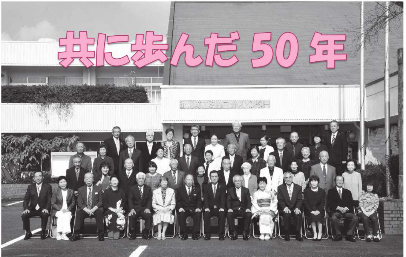
滑川町金婚式 令和3年10月15日

コロナ感染症予防対策の為、昨年度につづき今年度も金婚式の表彰のみさせていただきます。 結婚 50 周年おめでとうございます！