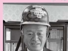
町長(会長)にも画像で協力頂きました！