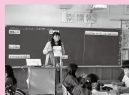
発達凸凹当事者 (発達障害)

「認知症サポーター養成講座」を、宮前小学校 4 年生・月の輪小学校 4 年生・滑川中学校 3 年生を対象に実施しました。滑川中学校では生徒数も多いので、初のオンラインでの実施となりました。