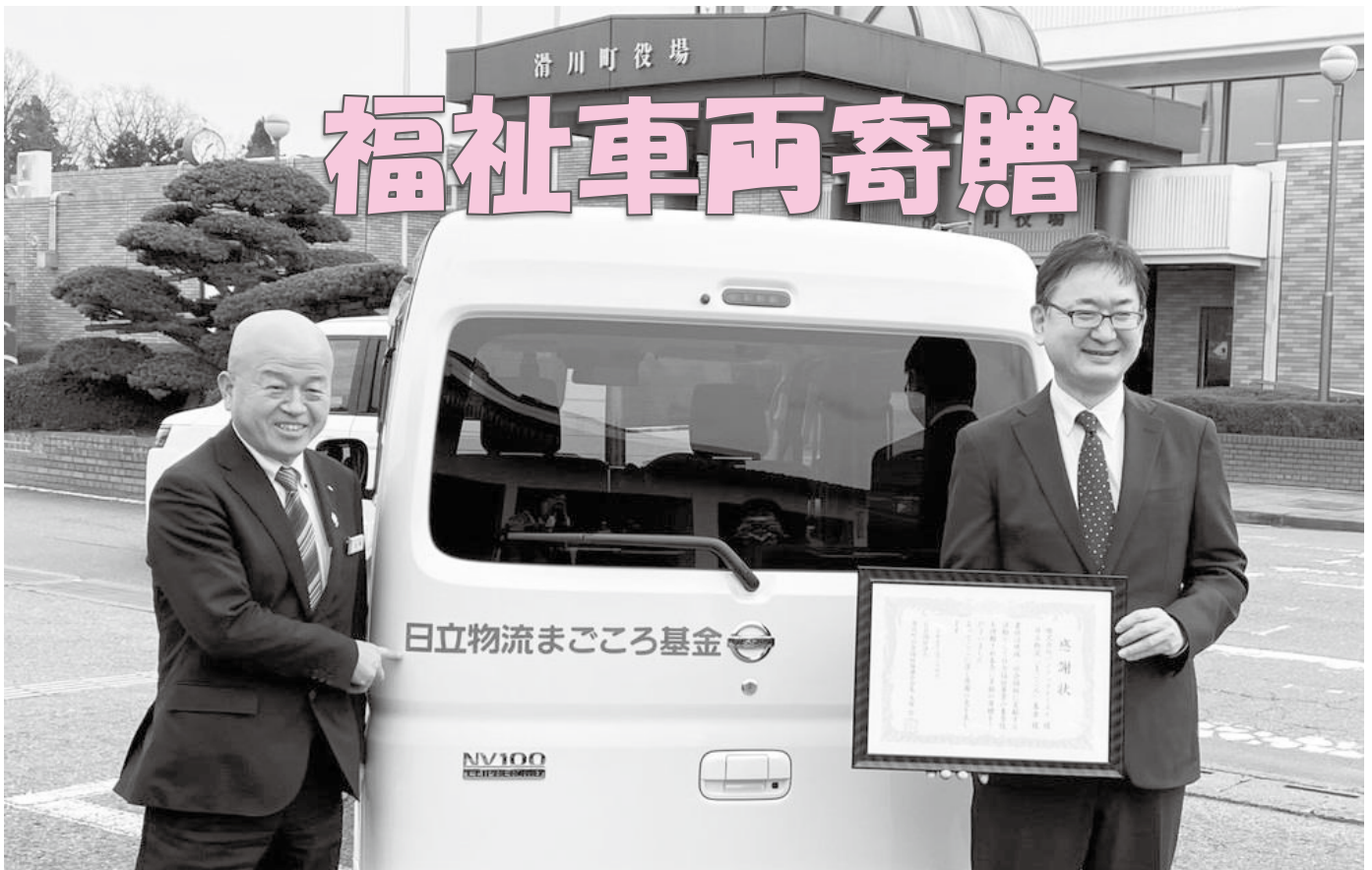
株式会社バンテックイースト様より 福祉車両と車いすの寄付をいただきました！ (詳細は2ページ)