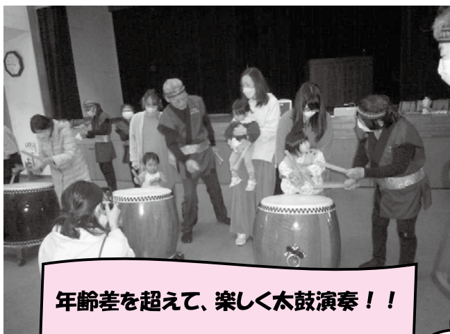
年齢差を超えて、楽しく太鼓演奏！！

これから超高齢化・少子化・核家族化がすすみ、より良く暮らし続けられるためには、地域での「助け合い」が必要不可欠です。新しい地域づくりを、生活支援コーディネーターと住民の皆さんと一緒にすすめていき、それぞれの楽しい居場所を作り上げていくことを目的としています。