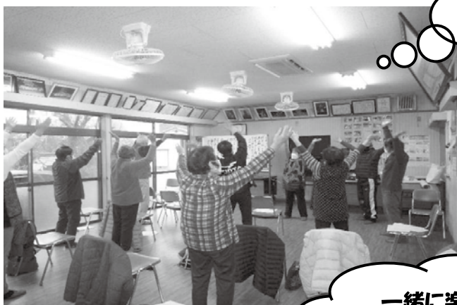
一緒に楽しんでくれる お仲間募集中！