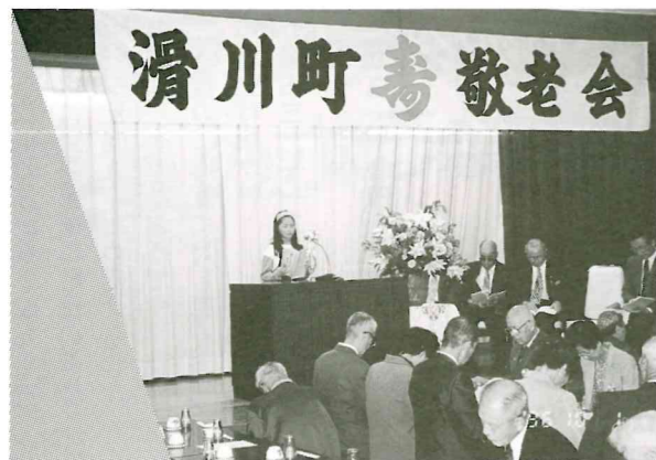
10月1日・2日・3日 敬老会