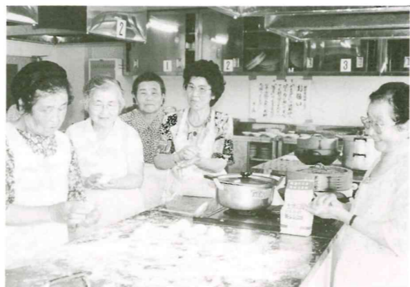
8月2日 セタまんじゅう作り