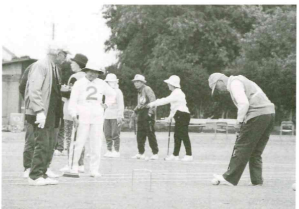
10月24日 ゲートボール大会