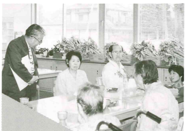
8月22日 豊科社協デイサービス視察