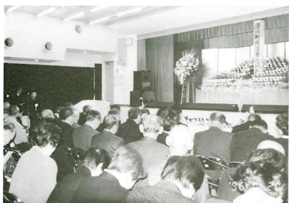
11月20日 戦没者追悼式