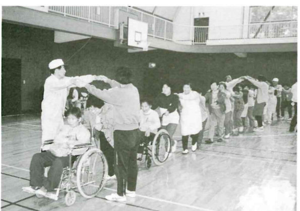
5月24日 福祉ふれあいのつどい