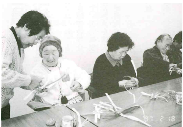
2月18日 単身老人手芸教室