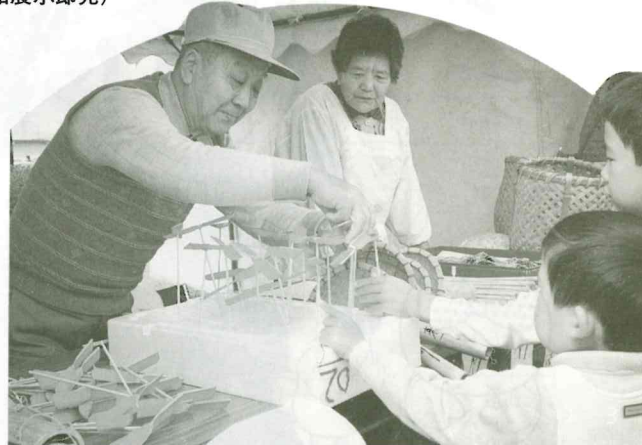
老人クラブ連合会