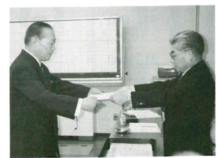
感謝状を手渡す社協会長