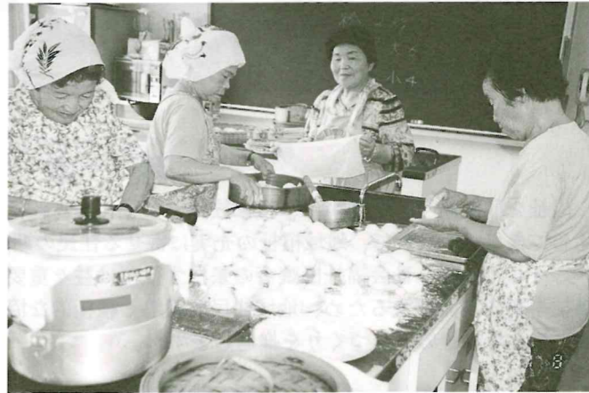
(8/1 セタまんじゅう作り)