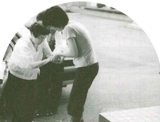
夏休み体験ボランティア