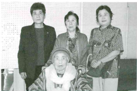
出席者のなかで最高齢者 101歳