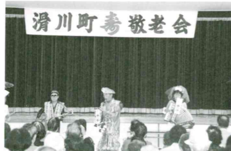
ボランティア12団体の皆さんご協力ありがとうございました