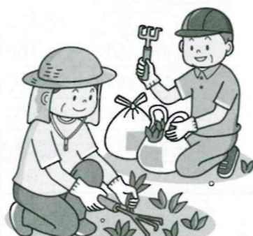
草むしりなど庭の手入れ