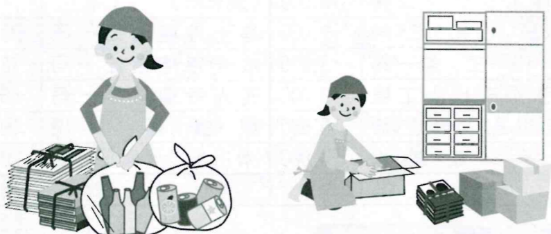
片づけ・掃除など身の回りの家事など