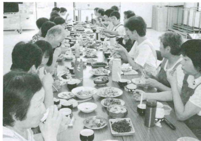
ゴーヤを材料に調理実習 (六軒)