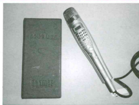
カラオケ(テレビにつないで楽しめます)