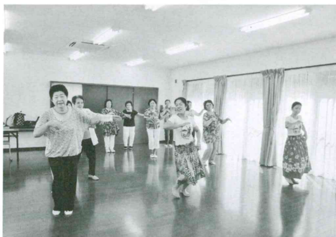
ボランティアさんと一緒にフラダンス (月の輪)