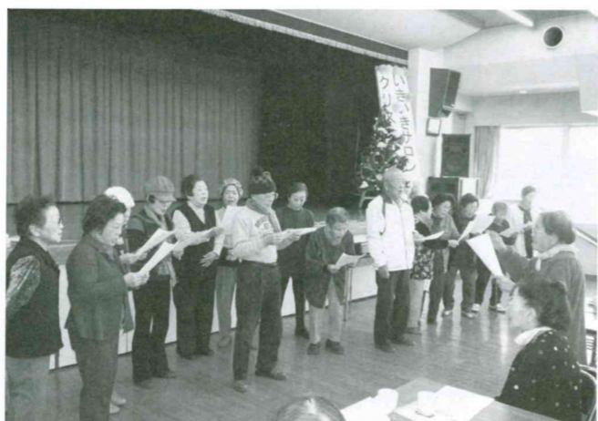
いきいきサロンクリスマス会にて(伊古・みなみ野)