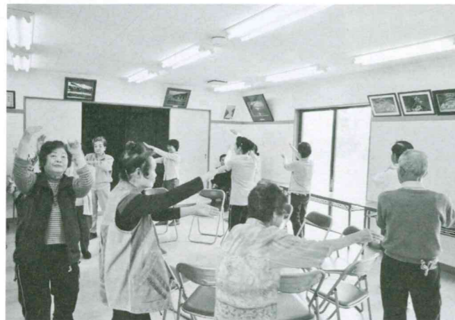
準備体操に滑川音頭 (みなみ野)

下福田(下向・古姓)・下山田・伊古・月の輪・みなみ野・羽二(表・平)・羽三・六軒