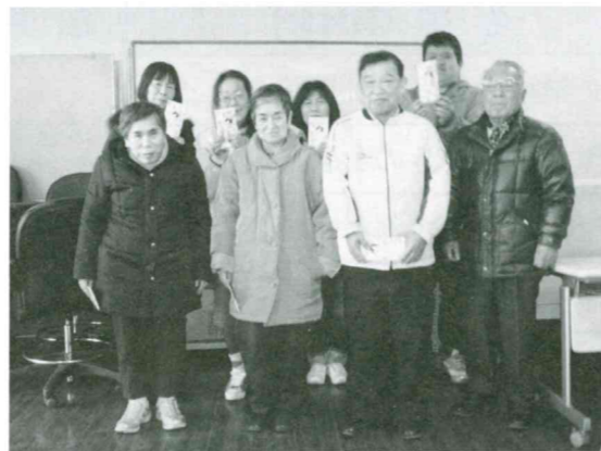
ボウリング入賞者の皆様

2月19日にふれあいのつどいを開催しました。手をつなぐ親の会、老人クラブ連合会、身体障害者福祉会、障害者事業所トウティフォルテの皆様に参加していただき、ボウリングと昼食会を行いました。久しぶりのボウリングでしたが、皆様力強くプレイされておりました。