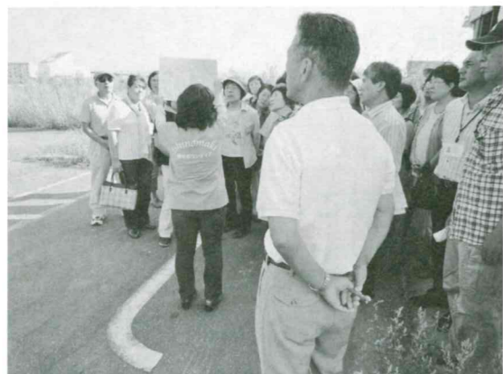
ボランティアによる被災地の説明

当日は、参加者40名で地元ボランティアによる被災と復興状況の説明があり、参加者は、買い物支援で協力して来ました。