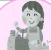
地域支え合い 事業