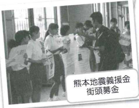
熊本地震義援金街頭募金