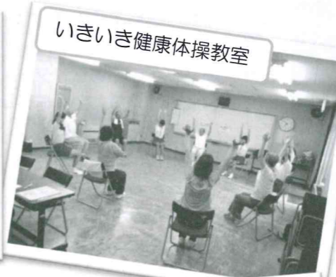
いきいき健康体操教室