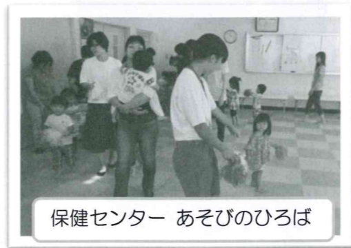
保健センター あそびのひろば

『夏の体験ボランティア』『中学生育成講座』は、ボランティア活動に関心があるけれど、なかなか“きっかけ”がないという方々のために、7月から9月の夏の期間を利用して、さまざまなボランティア活動の中から自分に合いそうなものを選んで参加できる企画です。今年度もたくさんの方にご参加頂きました！