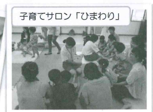
子育てサロン「ひまわり」