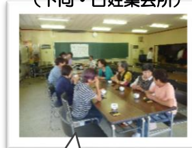
農作業中の方も合間に立ち寄ってくれました