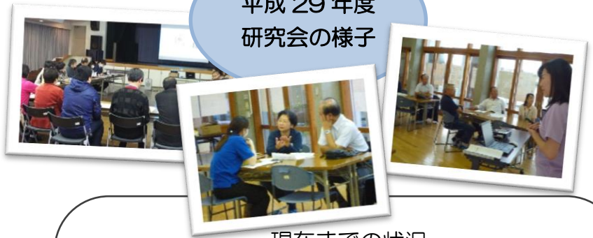
平成 29 年度 研究会の様子

地域の支え合いを推進するため生活支援コーディネーターを配置し、「誰もが安心して暮らせる滑川町」を目指して地域の皆さんと一緒に地域づくりに取り組むための研究会を実施しています。