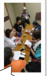
別の会合で集会所に来た老人会の方に漬物の差し入れを頂きました