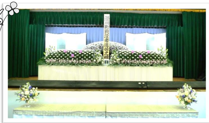
平成 25 年 11 月 追悼式に於いて