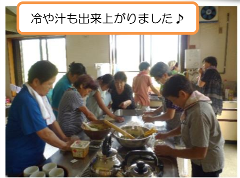
冷や汁も出来上がりました♪

地域の方が、気軽に集える居場 所づくりを目指して、今後も引 き続き開催していく予定です！