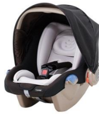
乳幼児カーシート貸出し