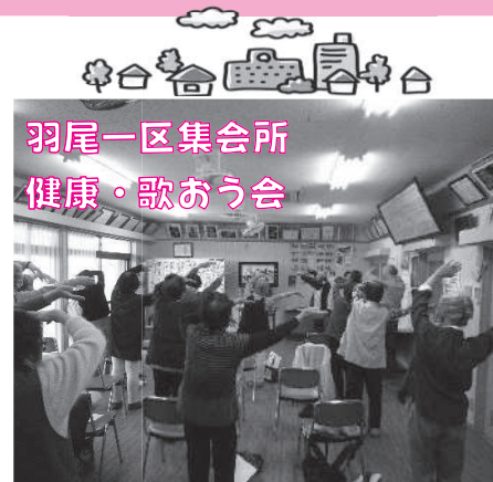
羽尾一区集会所 健康・歌おう会