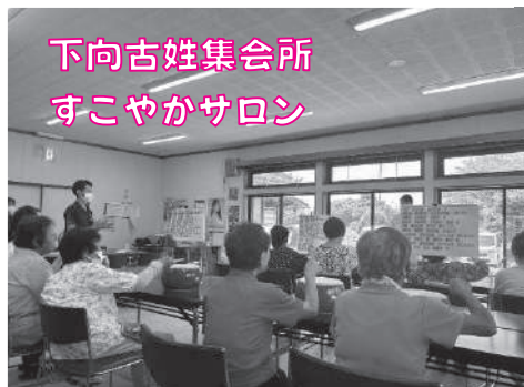
下向古姓集会所 すこやかサロン