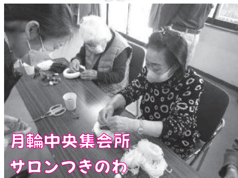
月輪中央集会所 サロンつきのわ