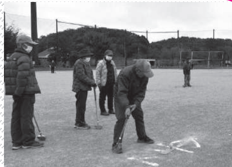
▲実際のプレーの様子