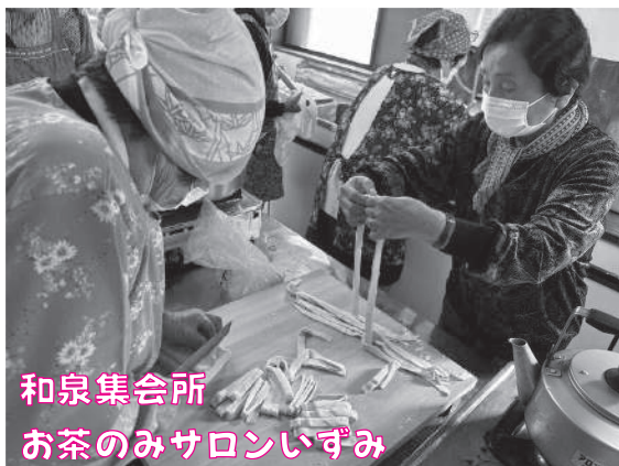
和泉集会所 お茶のみサロンいずみ